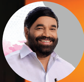
വി.എൻ വാസവൻ സാംസ്കാരിക വകുപ്പ് മന്ത്രി

ലോകത്തിന്റെ വിവിധ ഭാഗങ്ങളിൽ ക്യാമറയെ സമരായുധമാക്കി അവകാശപ്പോരാട്ടങ്ങൾ നടത്തുന്ന ചലച്ചിത്രപ്രവർത്തകരെ ആദരിക്കുന്നതിനായി