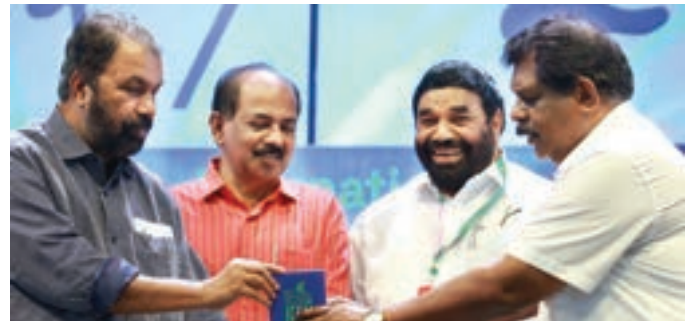
Minister for General Education and Labour, V. Sivankutty releasing the Festival Handbook to the Minister for Transport, Antony Raju