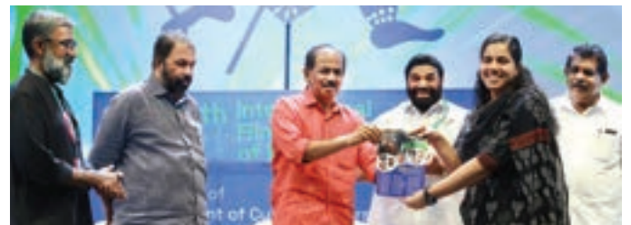
Minister for Food and Civil Supplies, G.R Anil releasing the Festival Bulletin by handing over the first copy to Arya Rajendran, Mayor of Thiruvananthapuram Corporation