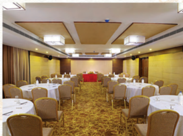
EMERALD (100 Pax Hall)