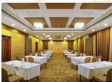
SAPPHIRE (100 Pax Hall)