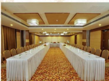
RUBY (125 Pax Hall)