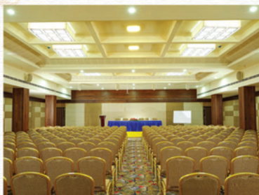
IRIS (400 Pax Hall)