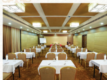
GARNET (125 Pax Hall)