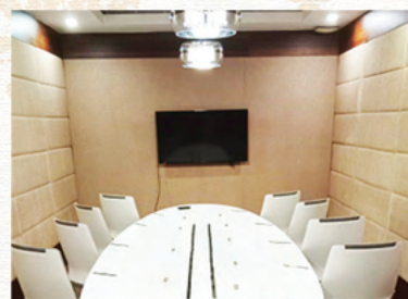
FORUM BOARD ROOM (12 Pax Hall)