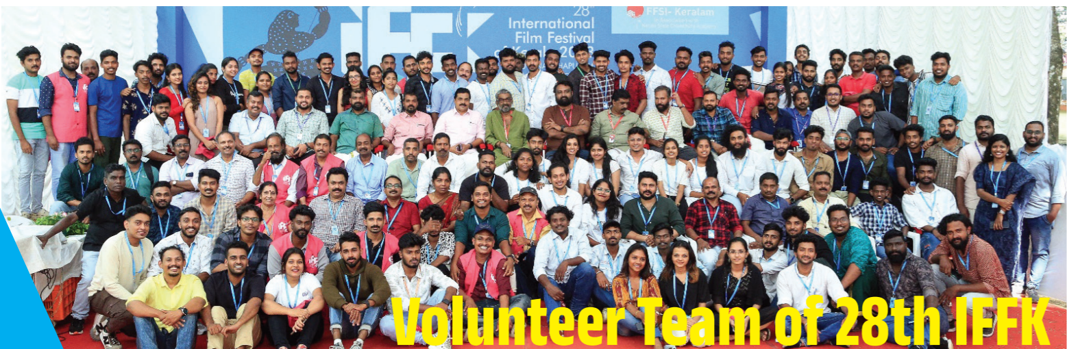
Volunteer Team of 28th IFFK