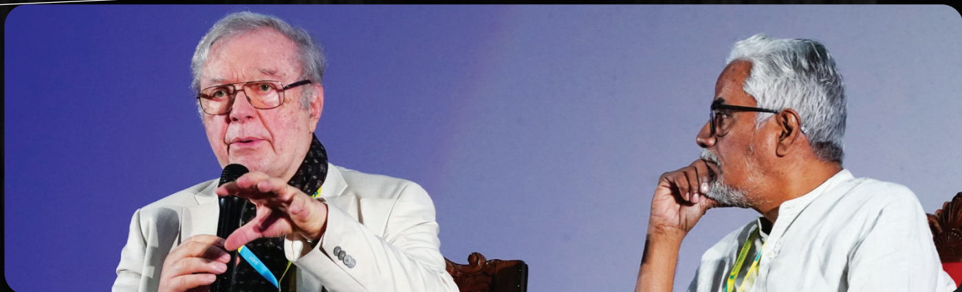
Krzysztof Zanussi In Conversation with C.S Venkiteswaran