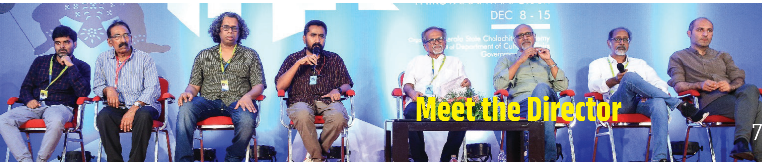
Meet the Director